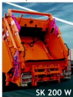
SK 200 W